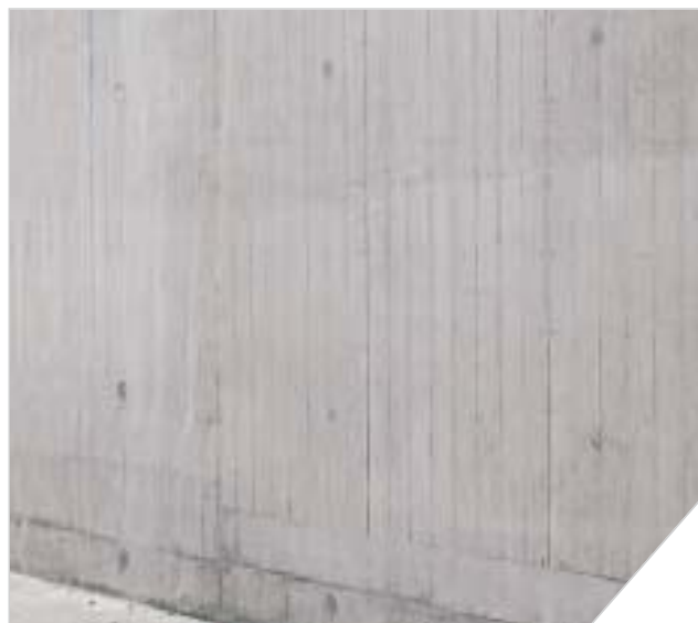
Ferdig vegg med innlimte betongkonuser.

Etter utblanding begynner herdingsprosessen umiddelbart, men man har likevel forholdsvis lang bearbeidingsstid: Ved 18°C anslås bearbeidingsstiden til 1,5 - 2 timer. Unngå direkte sollys, da dette øker temperaturen betraktelig og akselererer herdeprosessen. Se egen monteringsveiledning under PRODUKTER på www.haucon.no .